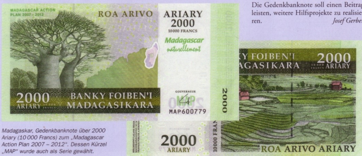
Madagaskar, Gedenkbanknote über 2000 Ariary (10 000 Francs) zum „Madagascar Action Plan 2007 – 2012“. Dessen Kürzel „MAP“ wurde auch als Serie gewählt.